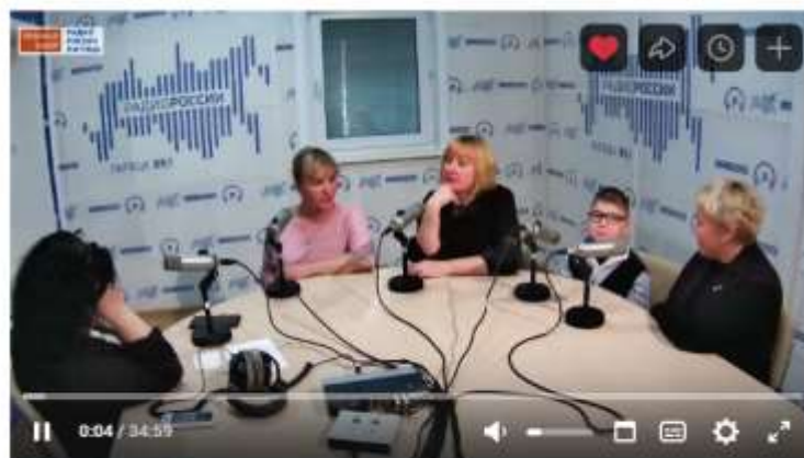
Live: Радио России | Липецк 1 101 просмотр